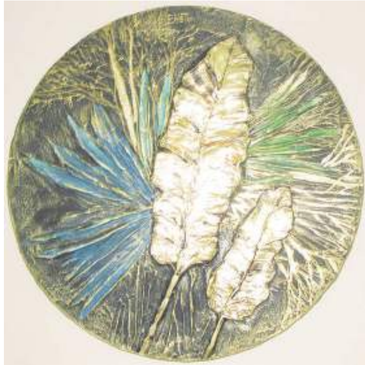
Е. Неткачева. Тропики

Да, замечательно смотрится закат на фоне зимнего леса в смартфоне, но так хочется