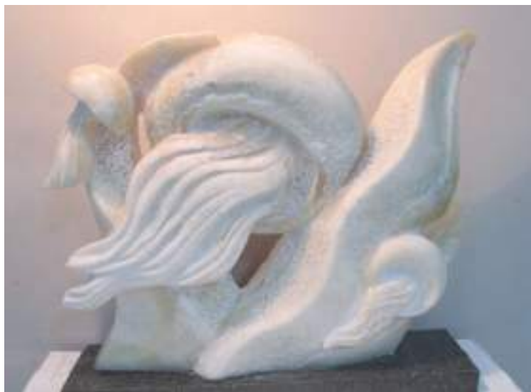
С. Лопухов. Подводное царство.