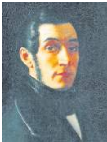
Фёдор Иванович Иноземцев

В Обнинске есть две улицы, названные в честь великих врачей XIX века – Пирогова (в «старом городе») и Иноземцева (в Белкине). Фёдор Иванович Иноземцев – местный уроженец, и то, что улица названа в его честь, вполне оправдано. Николай Иванович Пирогов никогда в наших краях не был, но к Калужской губернии имеет косвенное отношение – его вторая тётка, урождённая Щелочкина , родом из Полотняного-Завода. И так вышло, что Пирогов там венчался.