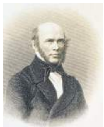
Николай Иванович Пирогов