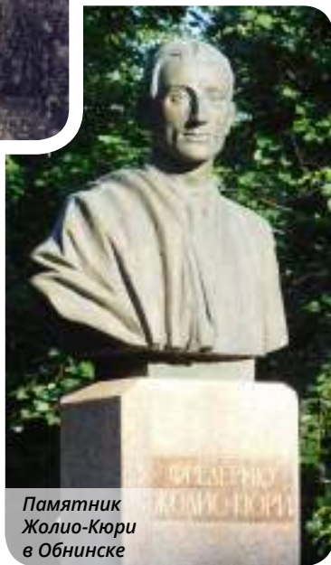
Памятник Жолио-Кюри в Обнинске

Он родился в богатой семье в Париже в 1900 году. Хорошо учился в частном пансионе, но после смерти отца материальное положение семьи сильно ухудшилось – пришлось перейти в муниципальную школу. Студентом стал не сразу, только в 1920 году начал заниматься в Высшей школе промышленной физики и хи-