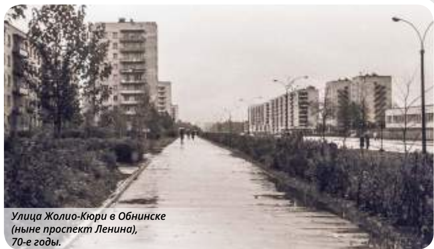
Улица Жолио-Кюри в Обнинске (ныне проспект Ленина), 70-е годы.

До 1977 года улица Жолио-Кюри, одна из центральных магистралей города, тянулась от нынешней Треугольной площади до ДК им 60-летия Октября (сейчас – городской Дворец культуры). Первый дом на ней (общезитие напротив Старого универмага) построили в 1958 году.