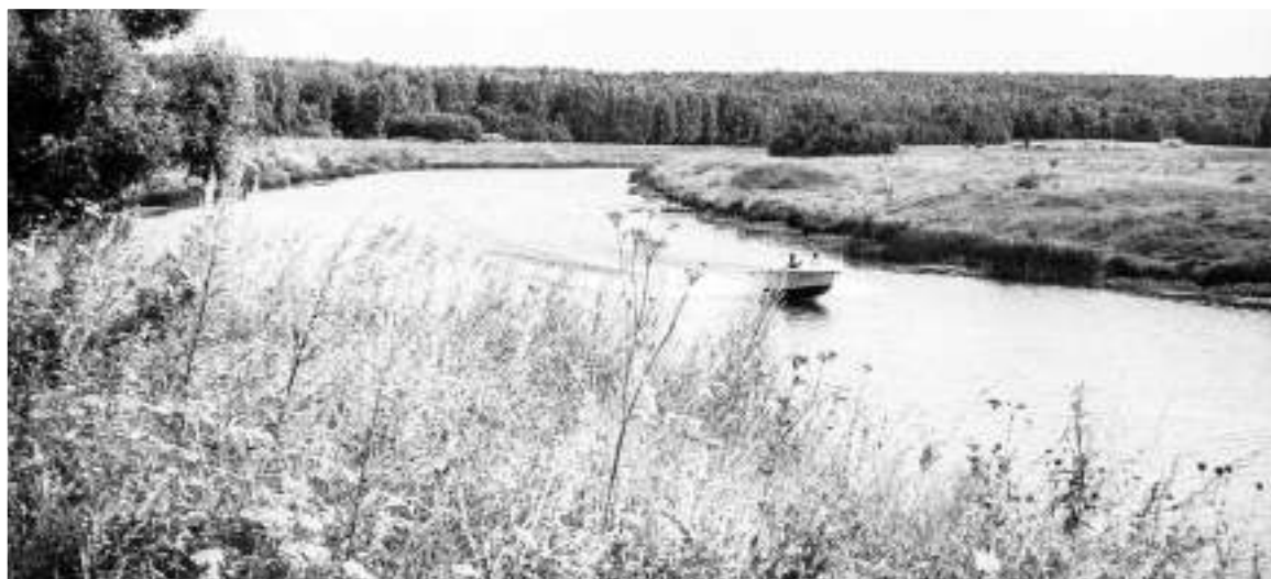
1975 год