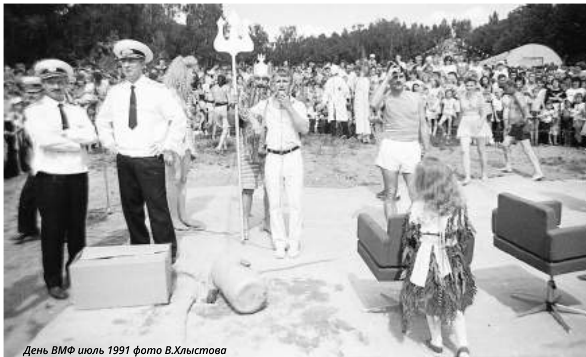
День ВМФ июль 1991