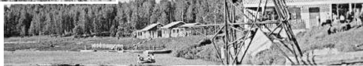
Вышка для прыжков в воду и кафе Поплавок 1956 год

Вышка стояла ещё до начала 70-х годов. Потом она либо сама