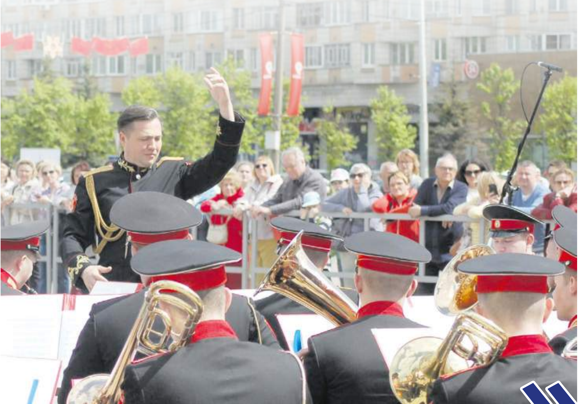
Минувшие выходные дни в Обнинске были отмечены ярким музыкальным событием – в нашем городе прошёл фестиваль-конкурс духовых оркестров и ансамблей барабанщиков «Славься, Россия!».